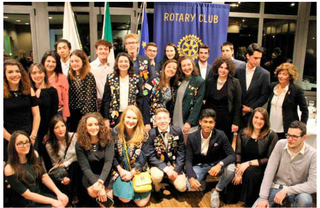
Gli studenti coinvolti nel service 'Parlare con i giovani e non dei giovani' curato da Renzo De Marchi e negli scambi internazionali promossi dai Rotary Club del distretto