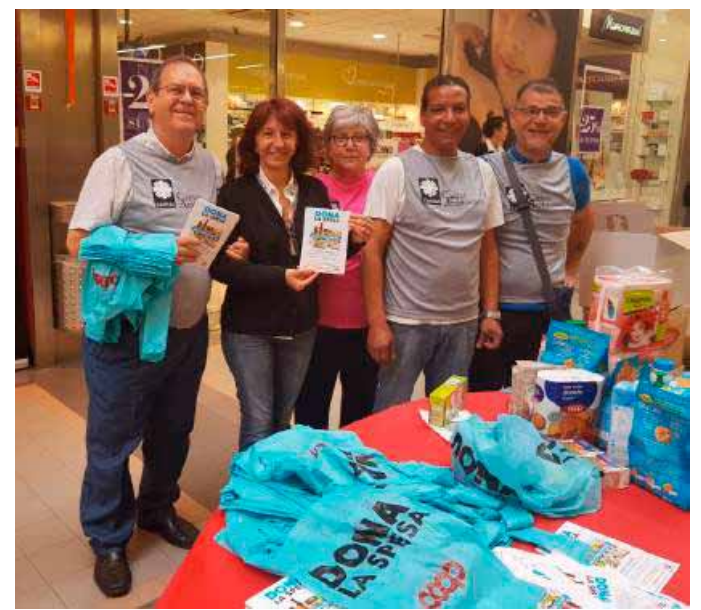
Volontari in uno dei punti di raccolta allestiti ieri nei centri Coop

fredo De Bellis - socio o consumatore, ha potuto scegliere direttamente i prodotti da donare (dai biscotti alla pasta, ai prodotti per l'infanzia all'olio alla farina), acquistandoli e consegnandoli ai volontari presenti ai presidi, soci Coop e rappresentanti delle associazioni beneficiarie. A fare da collante sui diversi territori sono state associazioni e organizzazioni che operano in ambito sociale. Alcune migliaia i volontari in azione. Si tratta della prima edizione di un progetto che si ripeterà anche in autunno, con le medesime modalità e una diffusione sempre più capillare. Un'iniziativa tanto più importante se si considera l'ultimo dato registrato dall'Istat, che quantifica in 4,5 milioni gli italiani in condizioni di povertà assoluta.